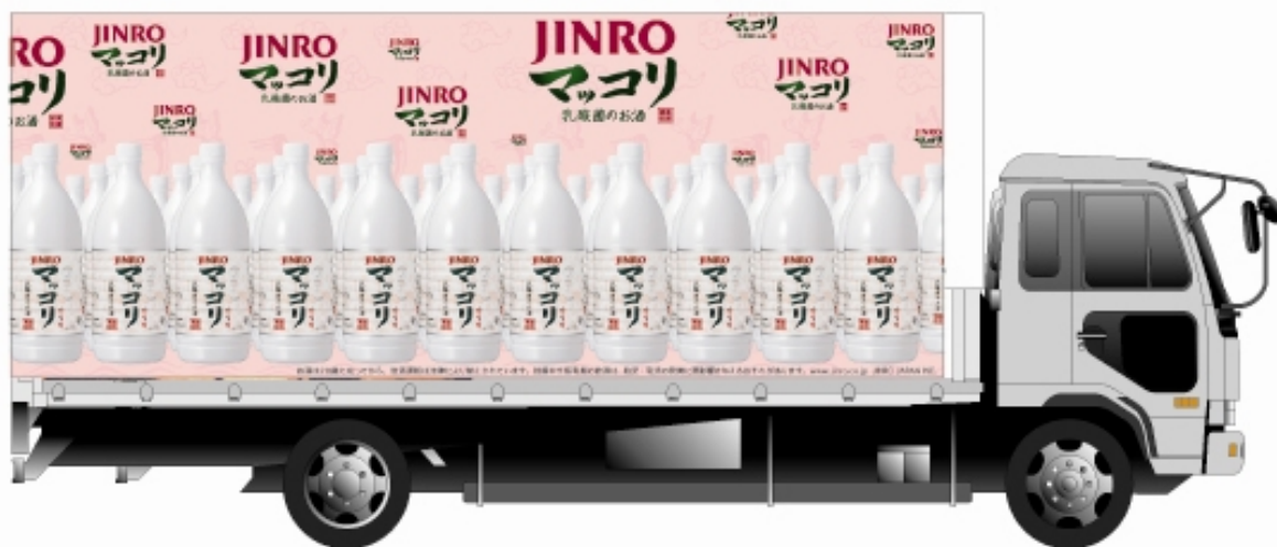
【「JINRO マッコリ」ラッピングトラック】

このラッピングトラックは、主にマッコリをはじめとした JINRO 製品の配送に使われるもので、「JINRO」バージョンと合わせ全3車種になります。